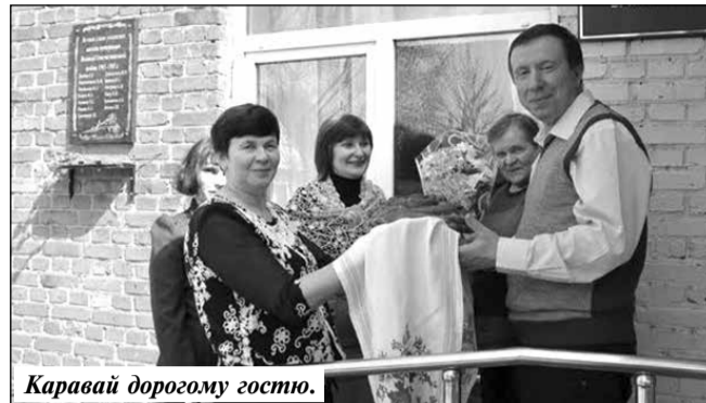
Каравай дорожному гостю.