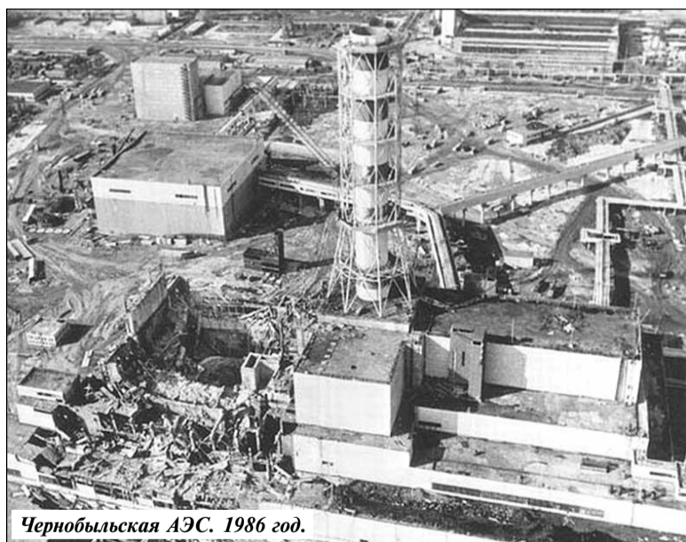
Чернобыльская АЭС. 1986 год.

не родным домом. Их заболевания были признаны радиационно обусловленными. В ту пору экспертный совет редко давал такие заключения. Но тяжелее всего было видеть, как аukaется чернобыльское эхо в детях.