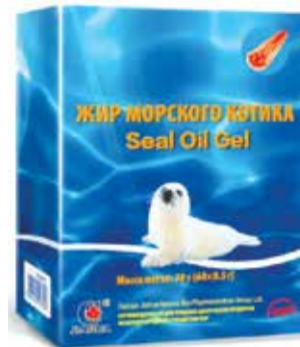
ЖИР МОРСКОГО КОТИКА

Лучший природный источник Омега-3 полиненасыщенных жирных кислот трех видов (EPA, DHA и DPA), каждая из которых оказывает свое влияние на организм.